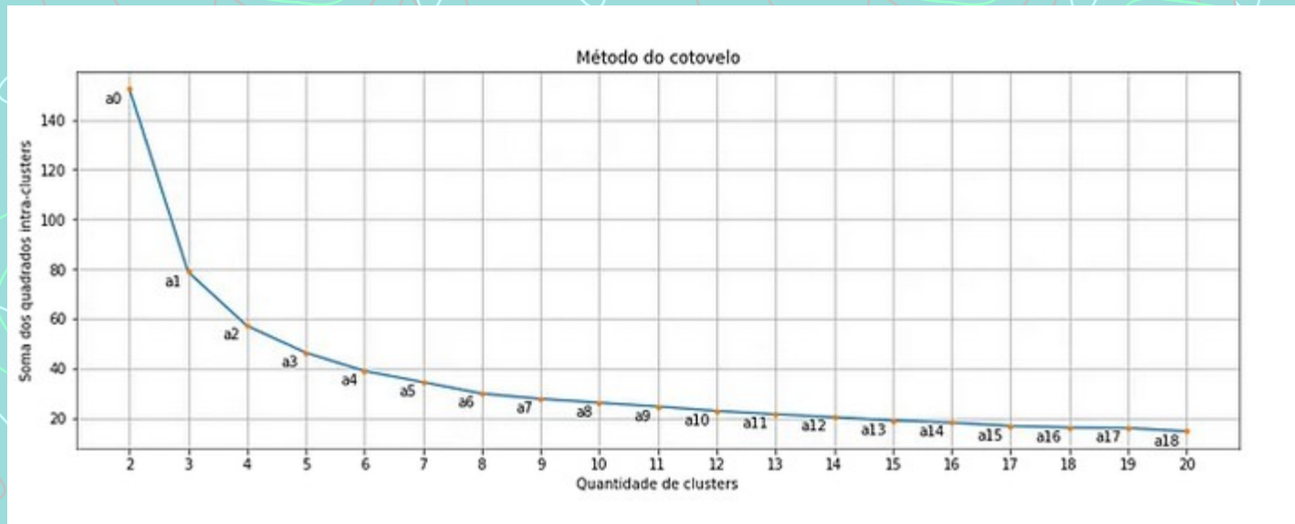
Gráfico soma dos quadrados intra-cluster x quantidade de cluster